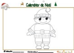
Calendrier de Noël page 13