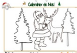
Noël page 20