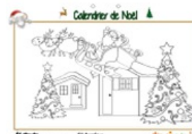
Calendrier de Noël page 24