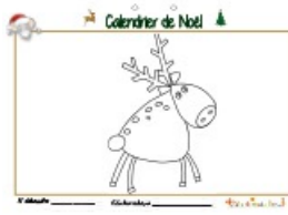
Noël page 11