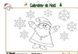
Calendrier de Noël page 18