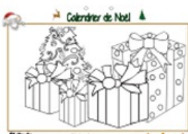
Calendrier de Noël page 25