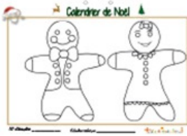
Calendrier de Noël page 10