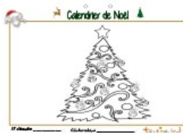
Noël page 17