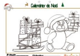
Calendrier de Noël page 21