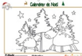
Noël page 14