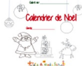
Couverture du calendrier de Noël