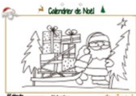
Calendrier de Noël page 22