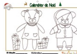
Calendrier de Noël page 15