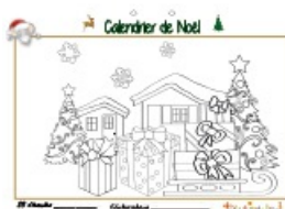
Noël page 23