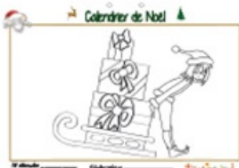
Calendrier de Noël page 16