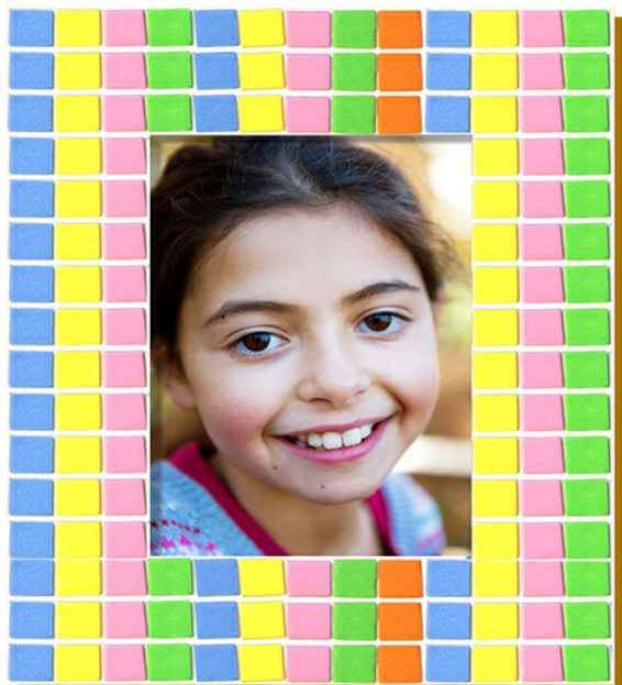
Cadre photo mosaïque en caoutchouc