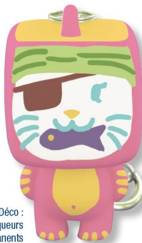
Déco : marqueurs permanents