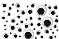
Yeux mobiles noirs à coller - Dimensions au choix