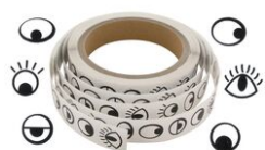
Gommettes yeux fantaisie noirs - 1000 Stickers