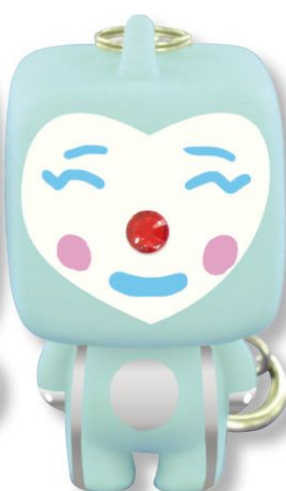
Déco : marqueurs permanents, sticker strass