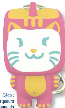
Déco : marqueurs permanents