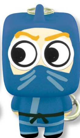
Déco : marqueurs permanents et stickers yeux