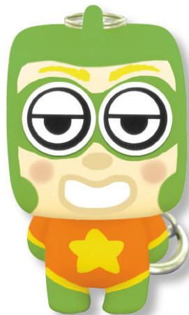
Déco : marqueurs permanents et stickers yeux