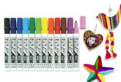
Marqueurs encres permanentes - Multi-support