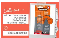
Colle contact Universelle - Avec Solvants