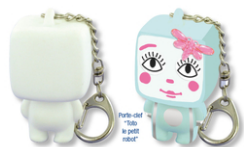
Porte-clefs "Toto Le Petit Robot" - Lot de 4