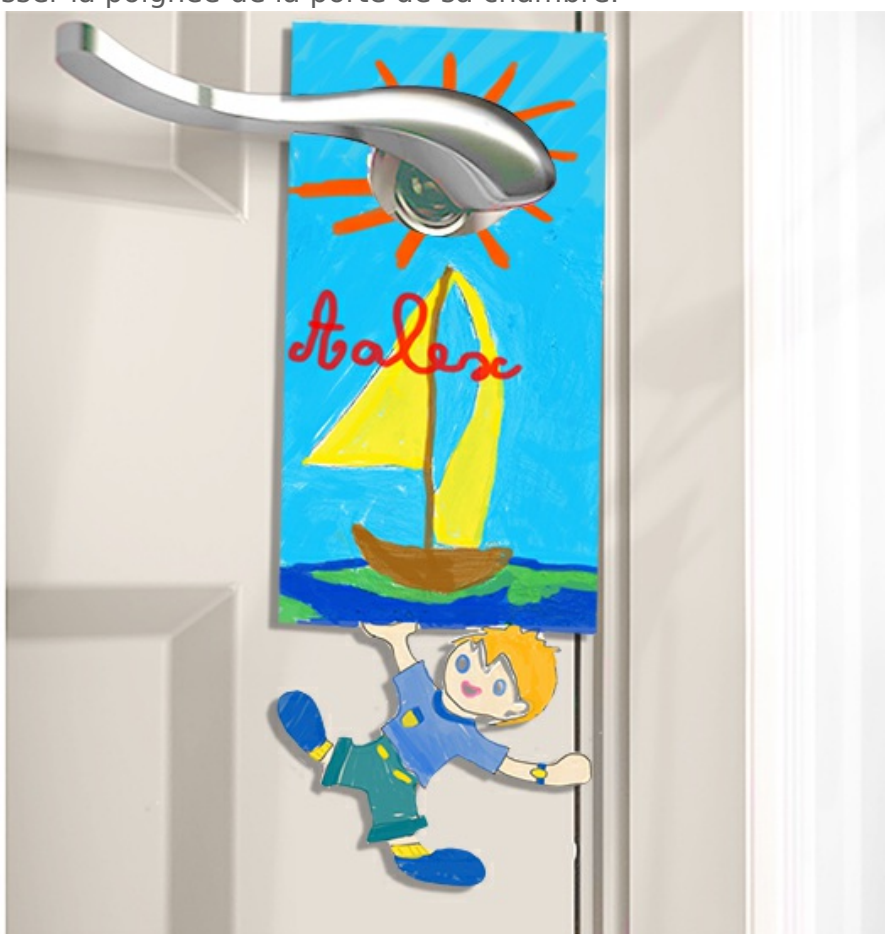
Plaque de porte personnalisée : garçon

La plaque de porte personnalisée est terminée, il ne reste plus qu'à la glisser la poignée de la porte de sa chambre.