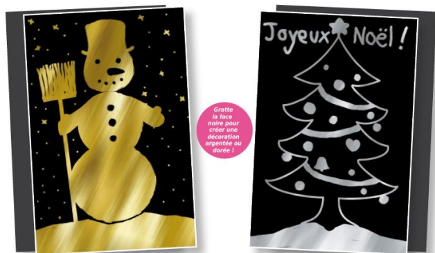
Set de 4 cartes à gratter métallisées brillantes 15 x 10 cm

Avec ces 4 belles cartes à gratter à fond or et argent, votre enfant aura un autre point de vue sur ses vacances ! Une fois terminée, la carte peut être envoyée à la famille et aux amis.