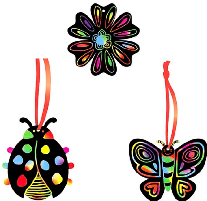
Petites décorations d'été en carte à gratter

Les décorations peuvent être utilisées pour la décoration du jardin ou de la terrasse.