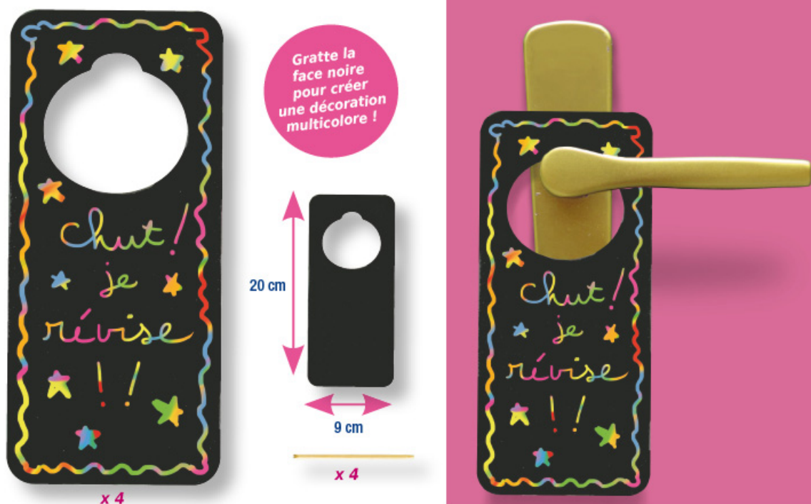
Set de 4 plaques pour poignées de porte en carte à gratter + 4 grattoirs

Gratter les plaques pour créer des décorations multicolores !