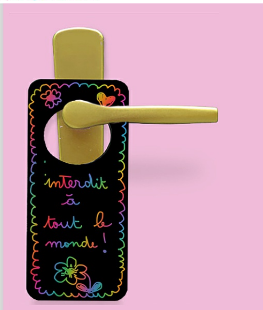
Plaque de porte en carte à gratter