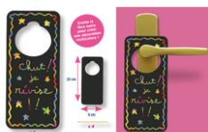
Set de 4 plaques pour poignées de porte en carte à gratter - 4 gratters

Plaques poignée de porte en carte à gratter + accessoires - 4 pcs