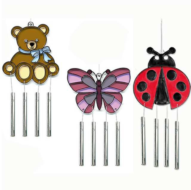
Carillons d'été à colorier et à suspendre

Faire la même chose avec les autres carillons translucides d'été.