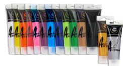
Peinture acrylique mate 75 ml