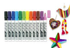
Marqueurs encres permanentes - Multi-support