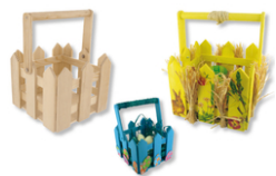
Panier en bois