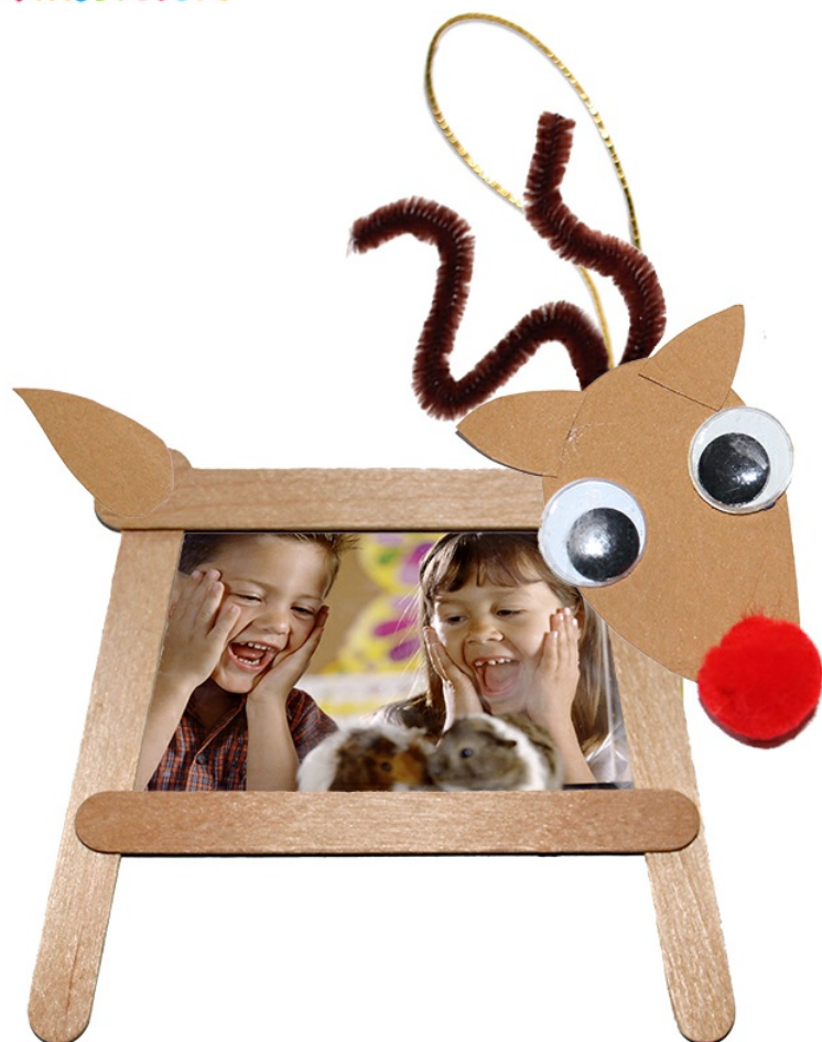
Cadre photo renne de Noël en bâtons de bois