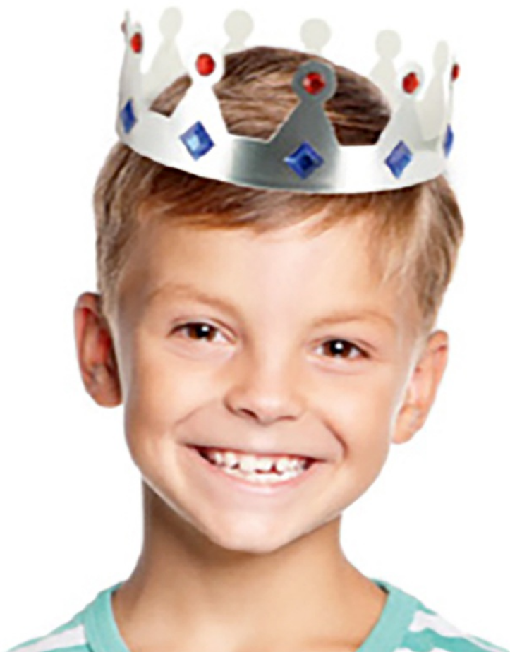
Couronne or et argent décorée de strass

La couronne terminée il ne reste plus qu'à la coiffer !