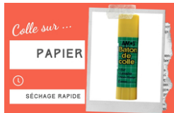
Bâton de colle blanche - Sans solvants