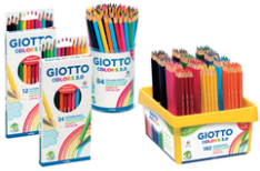
Crayons de couleur GIOTTO Colors 3.0