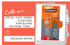
Colle contact Universelle - Avec Solvants