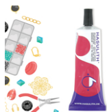
Colle Bijoux Hasulith - 30 ml