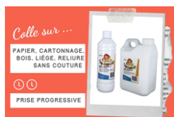
Brut de Colle - Colle forte qualité professionnelle