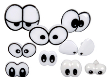
Yeux Funky Emotion - Set de 9 paires