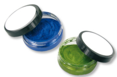
Crème de patine brillante