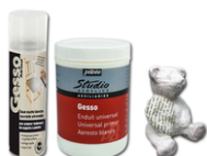
Gesso : Apprêt blanc prêt à l'emploi