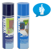
Aérosol Vernis mat ou brillant