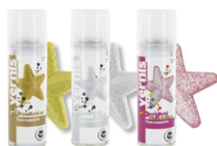
Vernis aérosol Pailleté - 125 ml