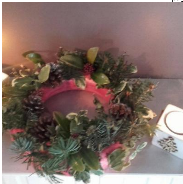
ETAPE 8 : UTILISER POUR VOTRE DÉCORATION

Votre décoration est prête à être installée sur le centre de votre table à Noël, à votre porte ou au milieu de votre buffet pour une décoration originale.