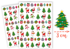
Gommettes Noël - 2 planches