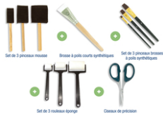
Set spécial matériels VERNIS COLLAGE