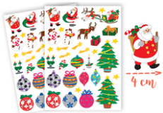
Gommettes de Noël - 2 planches