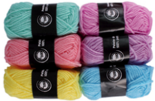
Pelotes de laine polyester, couleurs pastel - Set de 6