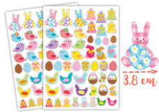
Gouaches de Pâques Vichy - 2 planches