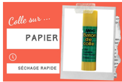
Bâton de colle blanche - Sans solvants