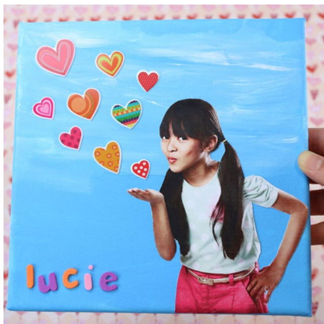
TABLEAU POP "GROS BISOUS"