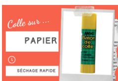
Bâton de colle blanche - Sans solvants