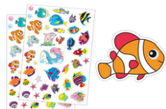
Gommettes poissons - 2 planches