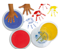
Encreurs géants colorés