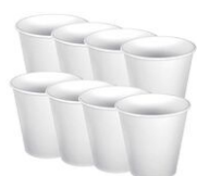
Gobelets en carton blanc