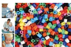
Perles fusibles à repasser, couleurs opaques