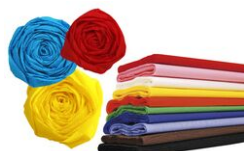
Papier crépon - A la couleur