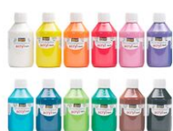
Peinture acrylique opaque 80 ou 250 ml - large choix de couleurs