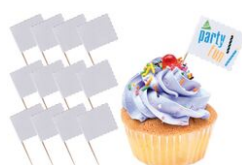
Mini-drapeaux à décorer