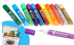
Stylos colle à paillettes - Couleurs assorties