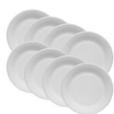
Assiettes en carton blanc