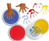
Encreurs géants colorés