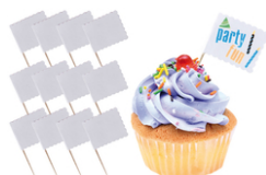
Mini-drapeaux à décorer