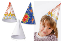
Cônes en carte forte blanche - Lot de 10