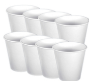
Gobelets en carton blanc