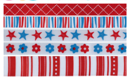
Camaïeu rouge et bleu - Réf. 27822

Rubans en camaïeu rouge et bleu - Set de 5