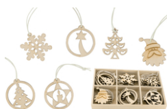
Coffret de motifs de Noël en bois naturel - Set de 18