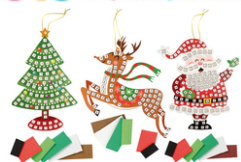
Suspension de Noël avec mosaïques