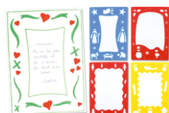
Pochoirs "Noël" pour poèmes et compliments - Set de 4