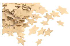
Étoiles en bois - Tailles assorties