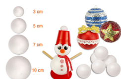
Boules en polystyrène