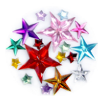
Strass étoiles - 200 strass