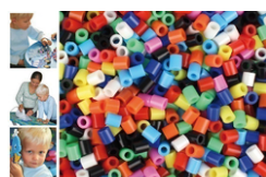
Perles fusibles à repasser, couleurs opaques