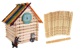
Bâtonnets crantés en bois pour construction