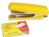
Agrafeuse + recharges