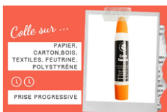
Colle forte avec double applicateur - Sans Solvants