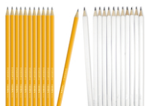
Crayons graphite hexagonaux HB