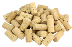
Bouchons en liège - Lot de 50