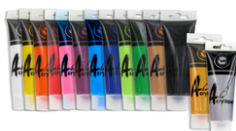
Peinture acrylique mate 75 ml