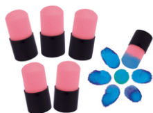
Tampons mousse peinture - Lot de 5