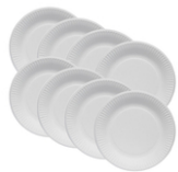
Assiettes en carton blanc