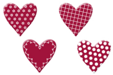
Coeurs fantaisie en bois décoré - Set de 8