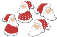
Pères Noël en bois décoré - Set de 8