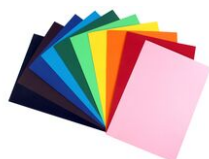
Feuilles colorées 220 gr/m 2 - 10 couleurs assorties