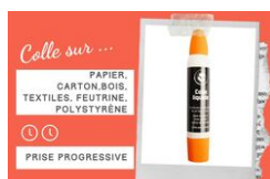
Colle forte avec double applicateur - Sans Solvants