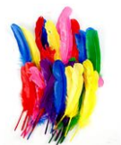
Grandes plumes indiennes assorties - Set de 36 plumes