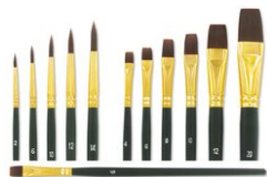
Pinceaux à poils synthétiques