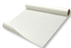
Rouleau de papier sulfurisé à repasser