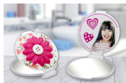
Miroir de sac à main