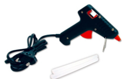
Pistolet à colle + recharge