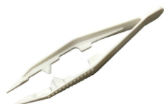
Pincettes spéciales perles fusibles- Lot de 4