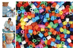
Perles fusibles à repasser, couleurs opaques