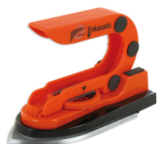
Fer à repasser