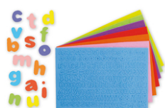
Stickers lettres minuscules en caoutchouc - 950 pièces